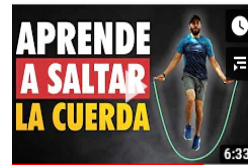
Como Saltar la Cuerda para Principiantes // Adrián Fit • 162.935 visualizaciones • hace 1 año Como saltar la cuerda para principiantes desde cero Obtén i siguiente código de ...

https://www.youtube.com/watch?v=61viNRuLA1g