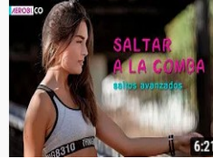
Como saltar a la comba - saltos avanzados Aerobico deporte salud • 108.807 visualizaciones • hace 4 i COMO SALTAR A LA COMBA: Aquí os traemos la segunda p comba. Si estás empezando ...

https://www.youtube.com/watch?v=TMGI1VVVD8M