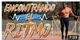
GUÍA DE SALTAR LA CUERDA PARA Cuerda de Saltar Viviendo Fit • 909.444 visualizaciones • hace 1 añ Como saltar la cuerda como boxeador? Para salta la coordinación y el ritmo ...

https://www.youtube.com/watch?v=r7ofZPkgVQc