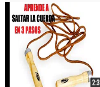
Cómo SALTAR a la CUERDA en 3 Pasos [SÚPER FÁCIL] deporte es vida • 176.140 visualizaciones • hace 5 años Aprende a saltar a la cuerda en tan solo 2 minutos, saltar a la cuerda en 3 pas costará un poco ... Subtítulos

https://www.youtube.com/watch?v=M_dMtKio584